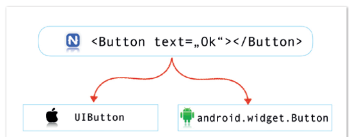
Abbildung 1: Projektion generischer UI-Elemente auf native Widgets

Für eine praktische App braucht es natürlich auch eine Verbindung zwischen Darstellung, Daten und Logik. Um dies zu implementieren, kommen die bekannten Angular-Paradigmen zum Einsatz. Angular-